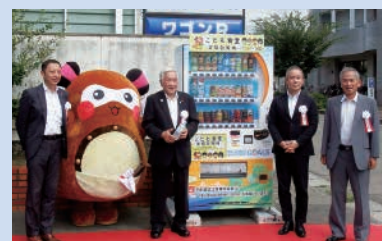
第1号のこども食堂支援自動販売機