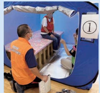
個室スペース体験

障がい者福祉センターでは、新型コロナウイルス感染症拡大防止対策を講じ、福祉避難所開設訓練を実施しました。第1部は視覚、聴覚、精神障がい者の方、第2部は地域活動支援センター「いぶき」や生活介護事業所の利用者を対象に実施しました。参加者からは「障がい別にテントに色分けがあると分かりやすい」「実際に目で見て、触れることができよかった」との感想もいただきました。今回いただいたご意見やご要望は今後の福祉避難所開設訓練に活かしていきたいと思っております。