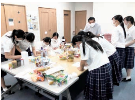
フードドライブでいただいた食品の仕分け作業中の新居浜南高校の皆さん